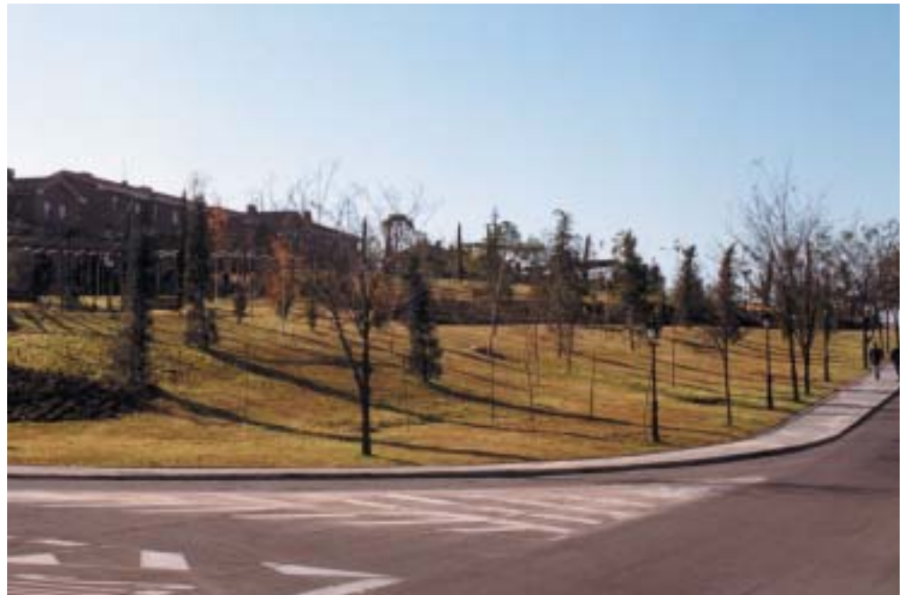
En la imagen, la II Fase de Ampliación del Parque París.

Además, se está preparando el proyecto del futuro Parque de La Marazuela , que estará terminado en otoño.