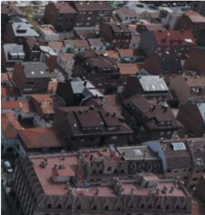
La Bolsa de Vivienda Joven es uno de los servicios más activos

El Ayuntamiento roceño ha aprobado la concesión de subvenciones a los propietarios de viviendas en nuestro municipio inscritas en la Bolsa de Vivienda Joven de la Concejalía.