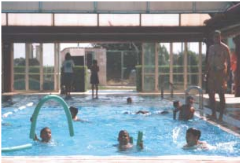
Como es lógico, la natación es una de las actividades favoritas.

La información completa estará a disposición de los interesados durante el mes de junio en el Centro de Servicios Sociales de Las Rozas, C/ Cdad. de La Rioja, 2.