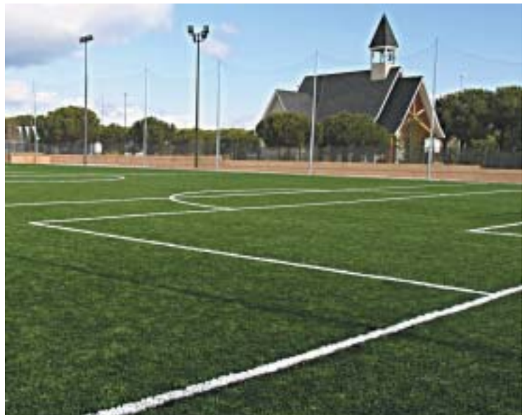
Los campos de hierba artificial del Recinto Ferial ya están siendo utilizados por numerosos equipos.

... de Skate, Monopatín y Bicicleta, en el Recinto Ferial, para disfrutarlo en verano. Inversión de 54.091 € (9 millones de pesetas).