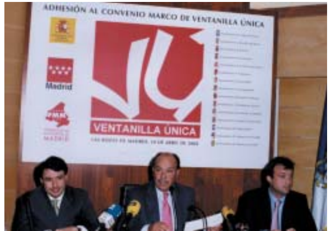
El Alcalde de Las Rozas junto al Secretario de Estado para la Administración Pública y el Consejero de Presidencia.

El pasado 10 de abril, quince Ayuntamientos de la Comunidad de Madrid, entre ellos el roceño, firmaron el Convenio Marco de Adhesión, por el cual se establece el funcionamiento del servicio de “Ventanilla Única”. Gracias a este servicio, los ciudadanos podrán entregar en Registro del Ayuntamiento cualquier documento cuyo destino sea tanto la Administración Central como la Autonómica. El lugar elegido para la firma del citado Convenio fue el Salón de Plenos del Ayuntamiento de Las Rozas. Al acto asistieron el Secretario de Estado para la Administración Pública y el Consejero de Presidencia de la Comunidad de Madrid , entre otros.