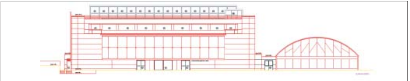
Plano del Alzado Oeste del nuevo Complejo Polideportivo de Las Matas

Con el objetivo de aumentar la calidad de los servicios ofrecidos por este Centro Polideportivo, ya han dado comienzo las obras de ampliación del mismo . Hasta la fecha, este Complejo sólo contaba con una piscina cubierta, un Pabellón Multiusos y un campo de fútbol descubierto. La ampliación permitirá centralizar las instalaciones de uso deportivo de Las Matas en un mismo espacio . La inversión municipal alcanza los 600 millones de pesetas, 3.219.125,9 Euros .