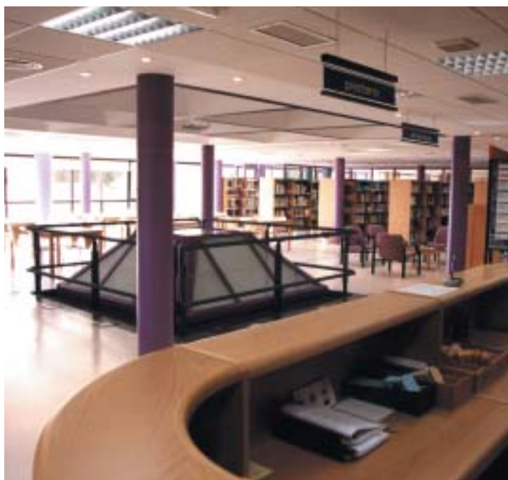
La Biblioteca de Las Matas se encuentra en el Centro Multifuncional

Destacan, este año, las lecturas dramatizadas a cargo de la Fundación Casa del Actor .