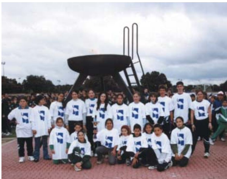
Los relevistas al completo

Las Olimpiadas Escolares son organizadas por la Concejalía de Educación en colaboración con el Área de Deportes.