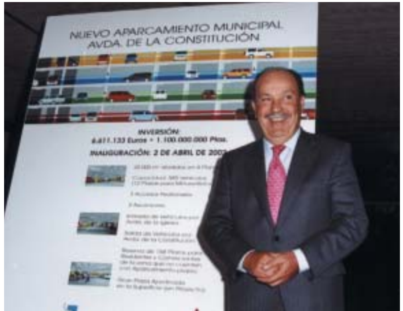
El Alcalde de Las Rozas junto al cartel con las características del nuevo Aparcamiento Municipal que ya está en funcionamiento

La inversión municipal ha sido de 6.611.133 Euros (1.100.000.000 de pesetas). Se espera que los jardines del exterior estén terminados en el mes de junio. Junto con las plazas del Auditorio, casi se alcanzan las 900 plazas en el radio de un kilómetro , a las que se unirán las del aparcamiento de Las Javerianas.