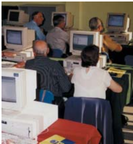
Nunca es tarde para aprender.

Desde el 27 de mayo, está abierto el plazo para inscribirse en los Cursos de Informática para mayores de 65 años que organiza la Concejalía de Servicios Sociales. Estos cursos favorecen el interés de los mayores por adquisición de nuevos conocimientos, fomentando un espacio de participación que potencie el interés por las nuevas tecnologías, ... porque nunca es tarde para adquirir nuevos conocimientos; como es el caso de Windows 98 y Word 97 básico y avanzado o navegar por Internet. Estos cursos son totalmente gratuitos .