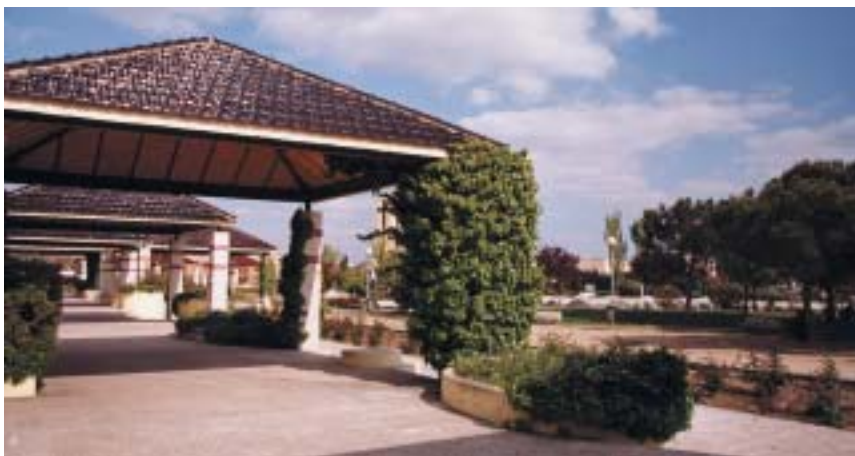
El Parque Primero de Mayo será una de las zonas verdes incluidas en el Programa de Mejora.

Ya han finalizado las obras de ajardinamiento del Parque de El Garzo . Esta zona verde está situada en la calle Cáceres, de Las Matas. Este parque ha sido embellecido con una fuente ornamental rodeada de senderos y dominado en su conjunto por praderas de césped.