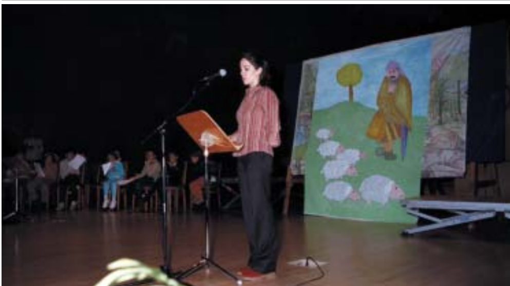
"Los árboles no son un cuento" fue el lema Internacional para ese Día.

Y el escenario fue el Auditorio Municipal, el pasado 21 de marzo. A este acto asistieron más de 300 escolares de Centros Docentes, Públicos, Privados y Concertados de la localidad.